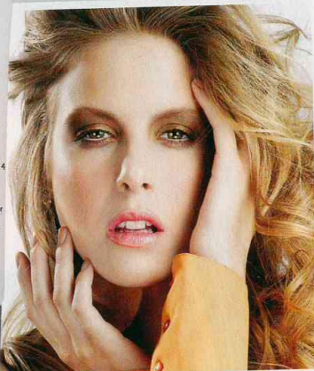
Garnier, Nara Garnier.

soin SOS multi-réparateur zones sèches visage - corps - cheveux multi-réparation SOS Care 30 jours face - body - hair